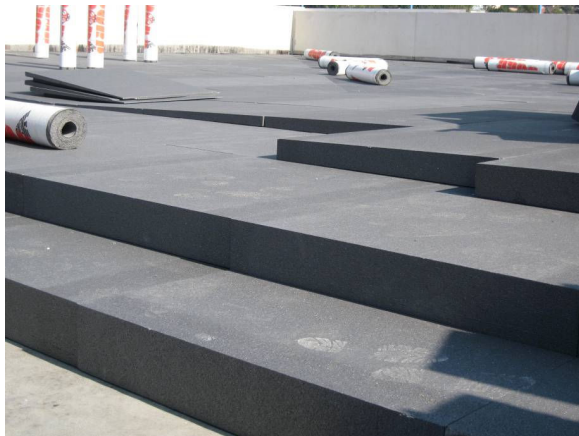
Dämmstärken auf dem Dach bis ca. 45cm