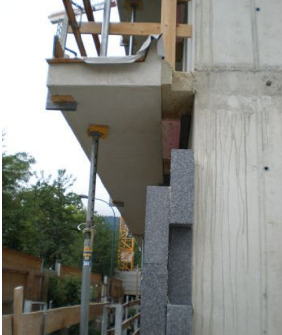
Thermische Trennung der Balkone