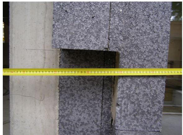
Dämmstärken auf Fassade bis 30cm